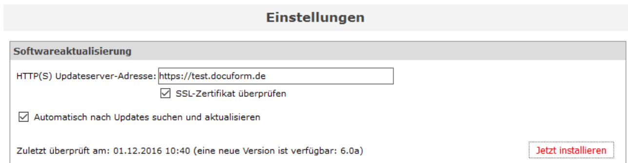
Abbildung 2: FSM Client Software neue Version verfügbar